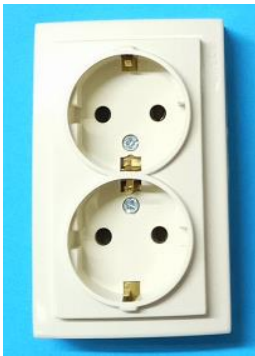
26121025 серия THEMIS