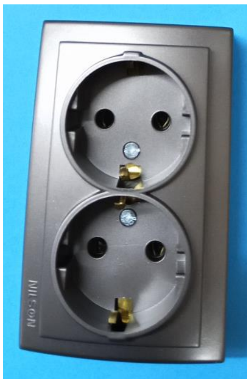
26161025 серия THEMIS