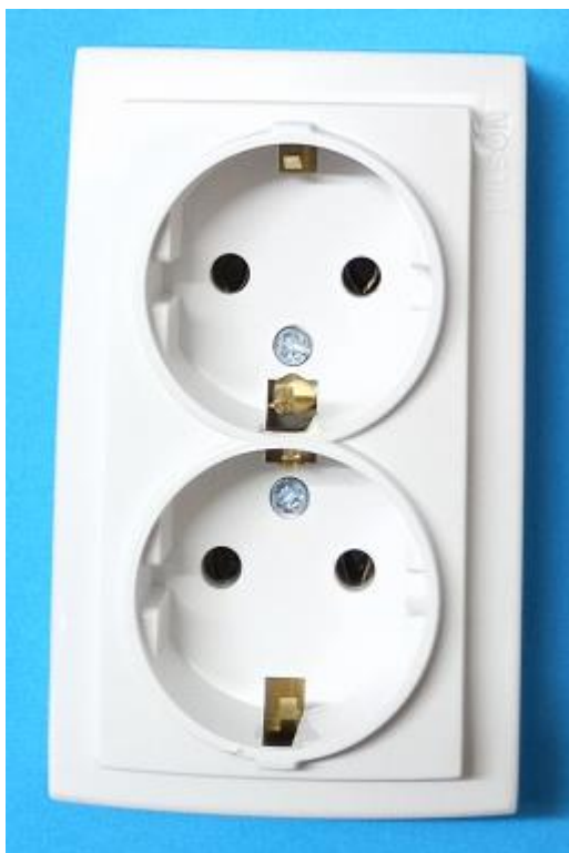
26111025 серия THEMIS