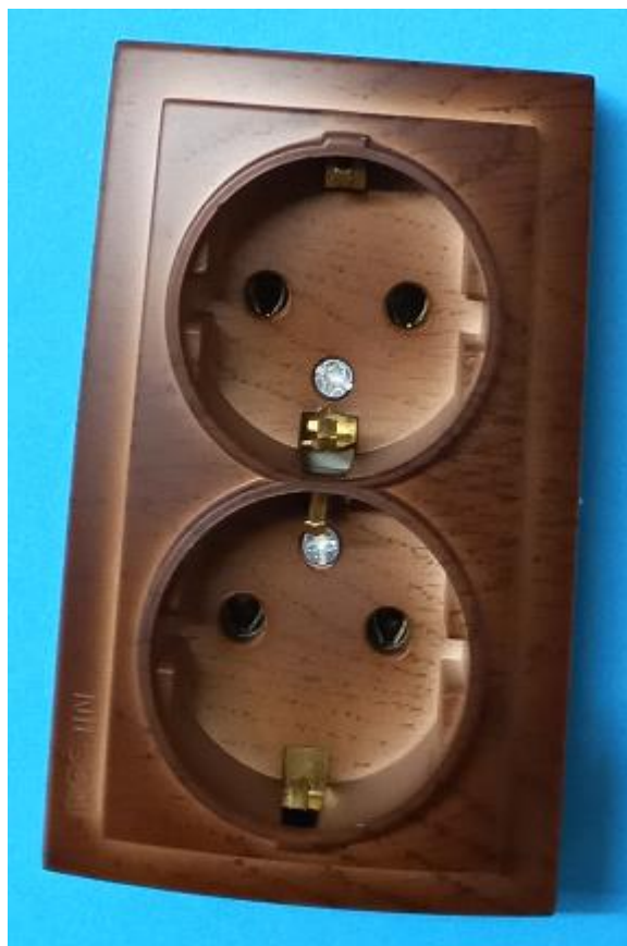
26271025 серия THEMIS